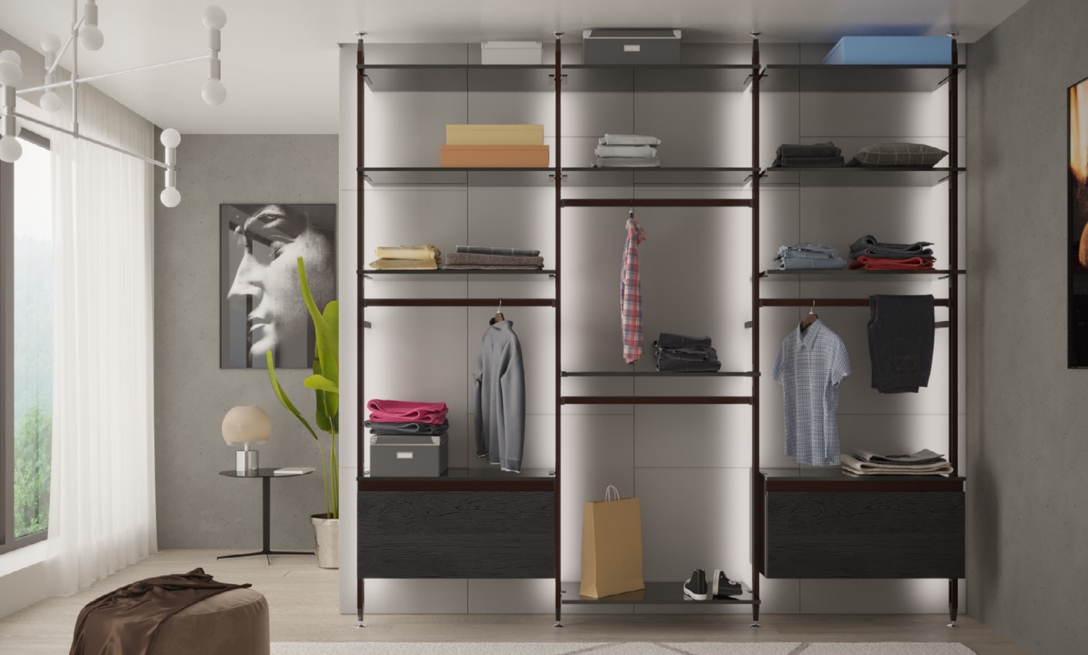
Гардеробна система «ПІДЛОГА-СТЕЛЯ», специфікація для глибини каркаса 295мм і 3-х секцій по 900мм